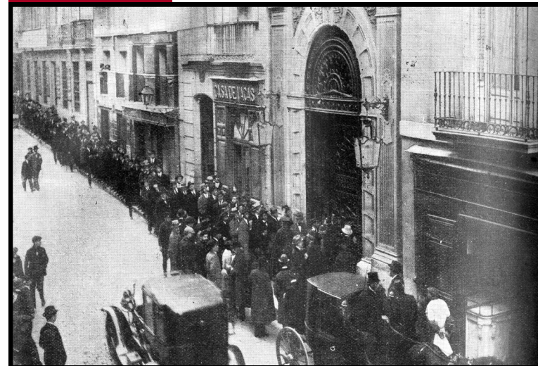
Fachada del Ateneo de Madrid, 1920

de la fundación del Ateneo Científico, Literario y Artístico de Madrid 1835-2010