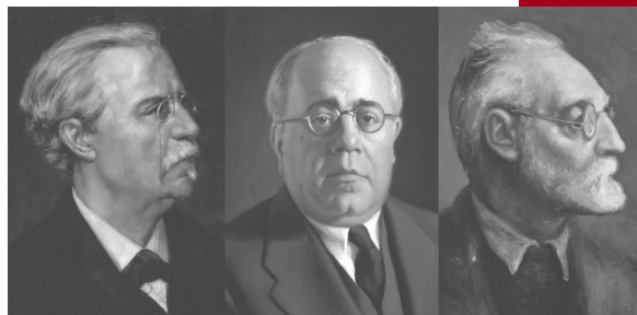
Cánovas del Castillo, Manuel Azaña, Miguel de Unamuno, presidentes del Ateneo de Madrid.

El 31 de octubre de 1835 la Real Sociedad Económica Matritense de Amigos del País convocó una reunión al objeto de estudiar el restablecimiento del Ateneo Español suprimido en 1823, y de la que salió la propuesta de crear un nuevo Ateneo Científico, Literario y Artístico de Madrid.